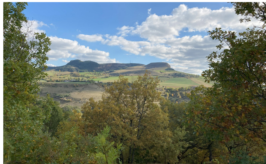
Au loin le Truc du Midi