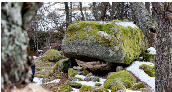
Le Dolmen de la Tailladisse