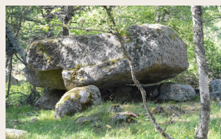
Le Dolmen de la Tailladisse

nitique massif de 5 m de long sur 2.80 m de large et d'un poids estimé à plus de 80 tonnes, reposant sur plusieurs blocs granitiques de grande taille à la disposition qui semble aléatoire. Sur la table est gravée une cupule d'où partent deux sillons creusés jusqu'au bord de la table.