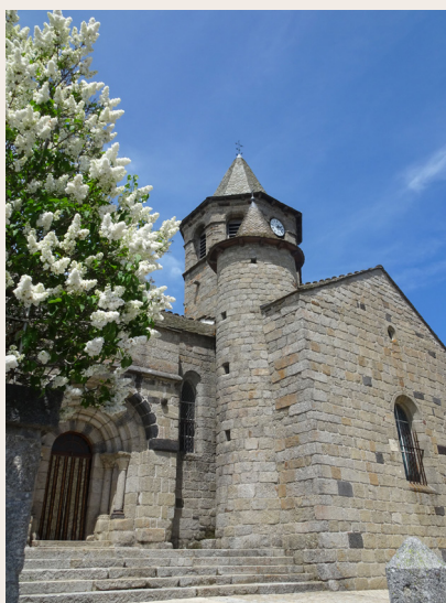
Église de Nasbinals

ronde, à l'angle de la nef et du transept abrite un escalier à vis. Enfin, ne manquez pas d'admirer un Christ du XVI ème s. et un retable en bois doré du XVII ème siècle.